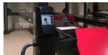
Styring og pumpe på bageste venstre søjle