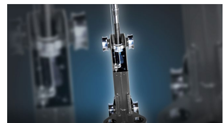
Løftestol med ruller