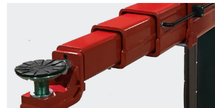
Trippel teleskopiske arme med F-konsoller