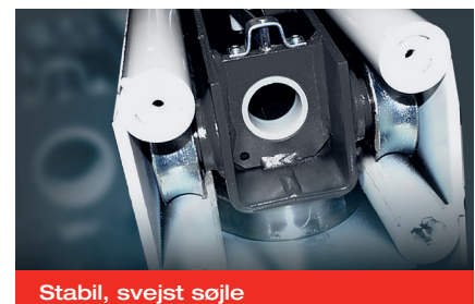
Stabil, svejst søjle