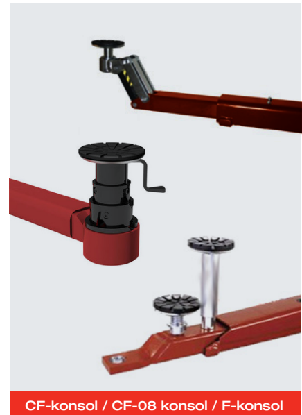
CF-konsol / CF-08 konsol / F-konsol